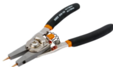
Pinze reversibili per anelli elastici interni ed esterni 200 mm 2928-200